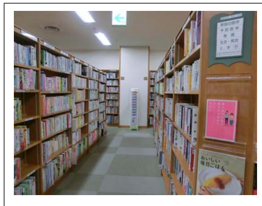
地階：医学に関する書架