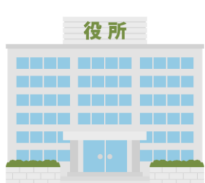
行政機関 (保健センター含む)