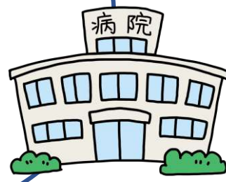
がん診療連携拠点病院