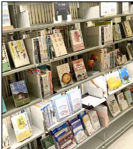
1-2.常設展示「がん情報コーナー」