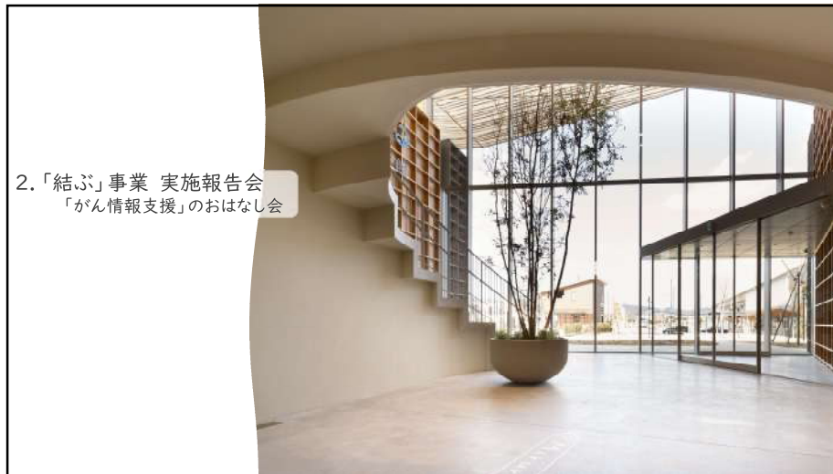
2.「結ぶ」事業 実施報告会 「がん情報支援」のおはなし会