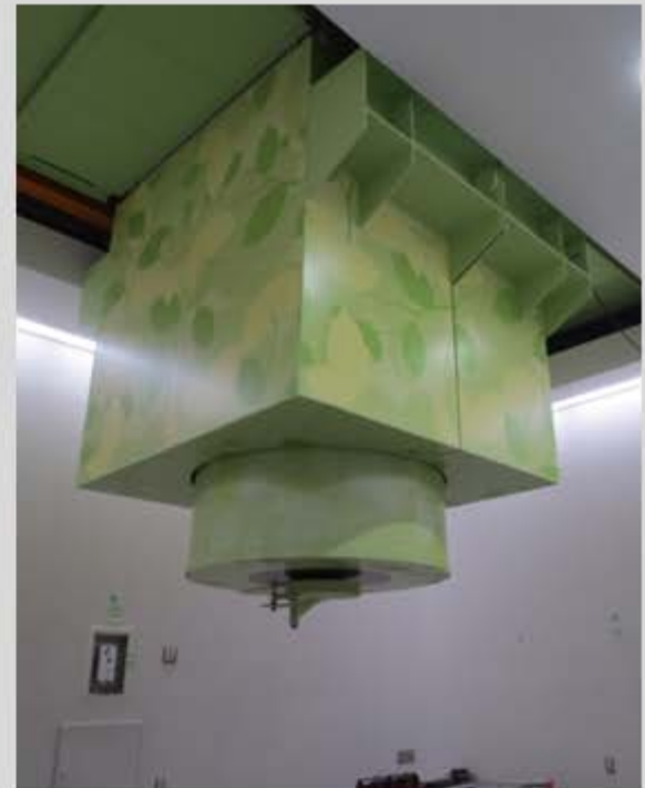
固体リチウムターゲットによる中性子照射装置を世界で初めて病院に設置