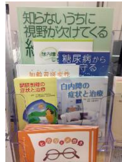
今まで行っていなかった、眼疾患の医療情報提供の実施