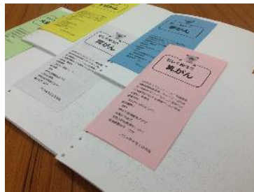
連携して発行する資料の即時点訳・音訳