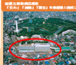
がん患者さんの多職種チーム医療

患者さん・ご家族のケア、職員教育等充実、医師・多職種によるチーム医療体制を構築しております。 がん治療相談室 17名 がん治療相談室 17名 がん化学療法認定看護師2名 がん放射線治療認定看護師1名 緩和ケア認定看護師2名 がん生活管理認定看護師2名 がん心理療養認定看護師1名 乳がん認定看護師1名 皮膚・排泄ケア認定看護師2名