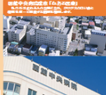
がん相談支援センター

患者さん・ご家族のケア、職員教育等充実、医師・多職種によるチーム医療体制を構築しております。 がん治療相談室 17名 がん治療相談室 17名 がん化学療法認定看護師2名 がん放射線治療認定看護師1名 緩和ケア認定看護師2名 がん生活管理認定看護師2名 がん心理療養認定看護師1名 乳がん認定看護師1名 皮膚・排泄ケア認定看護師2名