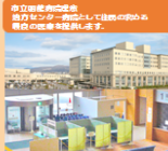
がん相談支援センター

患者さん・ご家族のケア、職員教育等充実、医師・多職種によるチーム医療体制を構築しております。 がん治療相談室 17名 がん治療相談室 17名 がん化学療法認定看護師2名 がん放射線治療認定看護師1名 緩和ケア認定看護師2名 がん生活管理認定看護師2名 がん心理療養認定看護師1名 乳がん認定看護師1名 皮膚・排泄ケア認定看護師2名