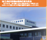
がん患者さんの多職種チーム医療

患者さん・ご家族のケア、職員教育等充実、医師・多職種によるチーム医療体制を構築しております。 がん治療相談室 17名 がん治療相談室 17名 がん化学療法認定看護師2名 がん放射線治療認定看護師1名 緩和ケア認定看護師2名 がん生活管理認定看護師2名 がん心理療養認定看護師1名 乳がん認定看護師1名 皮膚・排泄ケア認定看護師2名