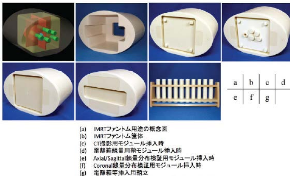
Figure 1 IMRT ファントムと各種内部挿入用モジュール