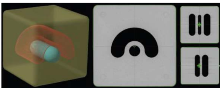
Figure 3 内部中央のリスク臓器とそれを囲むような馬蹄形のターゲット Axial 像(中央)、Coronal 像 (右上)、Sagittal 像 (右下)