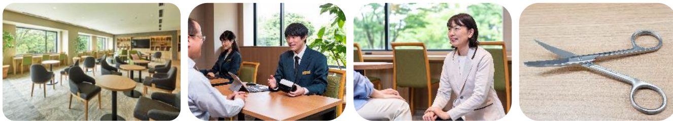
▲左から宿泊者専用ラウンジ / ITコンシェルジュカウンター / ケアスタッフ / ストーマ交換用はさみ

※本プランに関する問い合わせ先：三井ガーデンホテル柏の葉パークサイド 04-7137-6131