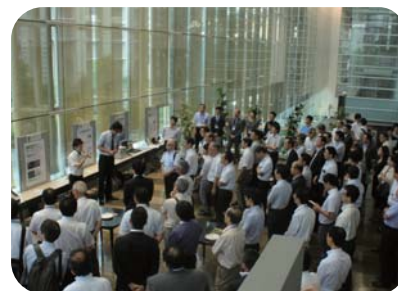
C-square EXPO 2016 ものづくり企業プレゼンの様子